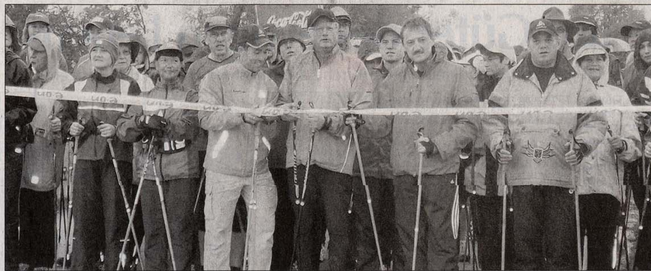
Landrat Volker Liedtke (Mitte) eröffnet das erweiterte Nordic-Walking-Zentrum. Die Rundstrecken wurden von sechs auf zehn aufgestockt und erstrecken sich mit Längen von 3,3 bis 17 Kilometer, verschiedenen Schwierigkeitsgraden und zahlreichen Verbindungswegen durch vier Gemeinden.